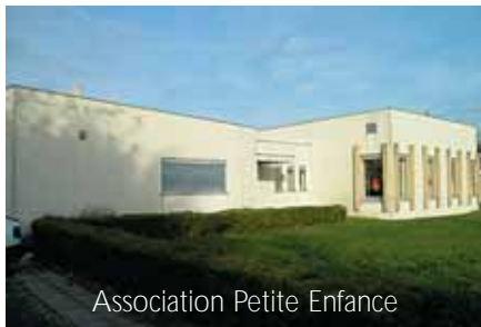
Association Petite Enfance

Pour toute information complémentaire, contactez le RAM du mardi au vendredi de 9h à 12h lors des permanences ou en téléphonant au 02 47 97 95 20.